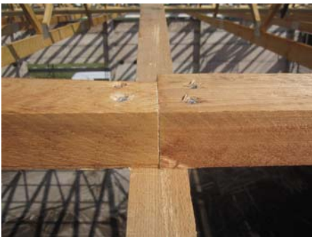
Lattenstoß auf Obergurt

Wegen Maßproblemen wurden die Löcher der Passdübel aufgebohrt. Damit ist die Tragwirkung dieses Anschlusses nicht mehr gegeben.