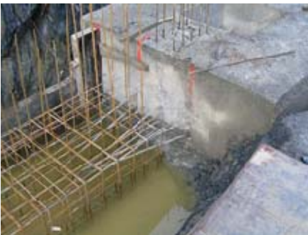
Köcher- bzw. Arbeitsfugenausbildung

Die Verwendung von Folie auf der Schalung verursachte eine unzureichende Oberflächenqualität der Decke.