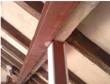
Pfettenverstärkung im Altbau

Wegen Maßproblemen wurde die Stahlstütze nicht unter den lastbringenden Stahlträger gestellt. Der Lastabtrag sollte über die Schweißnaht erfolgen.