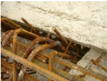
Rückbiegen der Bewehrung

Die Lage der Bewehrung ist verkehrt, die tragende untere Bewehrungslage wurde an der Oberseite des Treppenlaufes eingebaut. Das Bauteil ist nicht tragfähig.