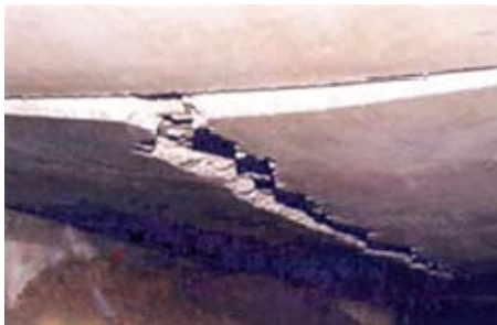
Abstützungen im Bauzustand

Bei diesem Bauvorhaben wurden die erforderlichen Hilfsunterstützungen im Abstand von ca. 1,50 m nicht eingebaut.