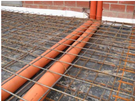
Bodenplatte mit integrierten Abwasserleitungen

Die Standsicherheit der Treppe war nicht mehr gewährleistet. Die Treppe musste abgebrochen werden.