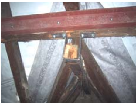
Dachverstärkung im Altbau

Wegen Maßproblemen wurde die Stahlstütze nicht unter den lastbringenden Stahlträger gestellt. Der Lastabtrag sollte über die Schweißnaht erfolgen.