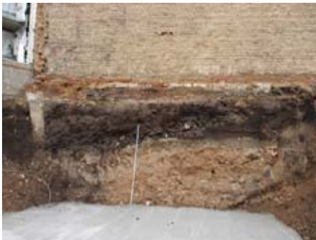
Sicherung der Nachbarbebauung